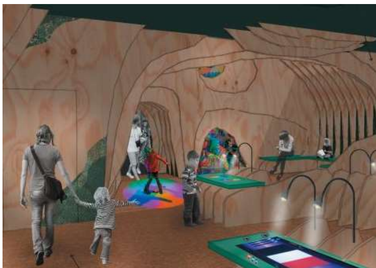
© Céline Daub & Clara Emo-Dambry

Le temps d'une visite, ils vivent une expérience magique, poétique, colorée et 100 % immersive !