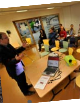
L'auditorium de 143 places.